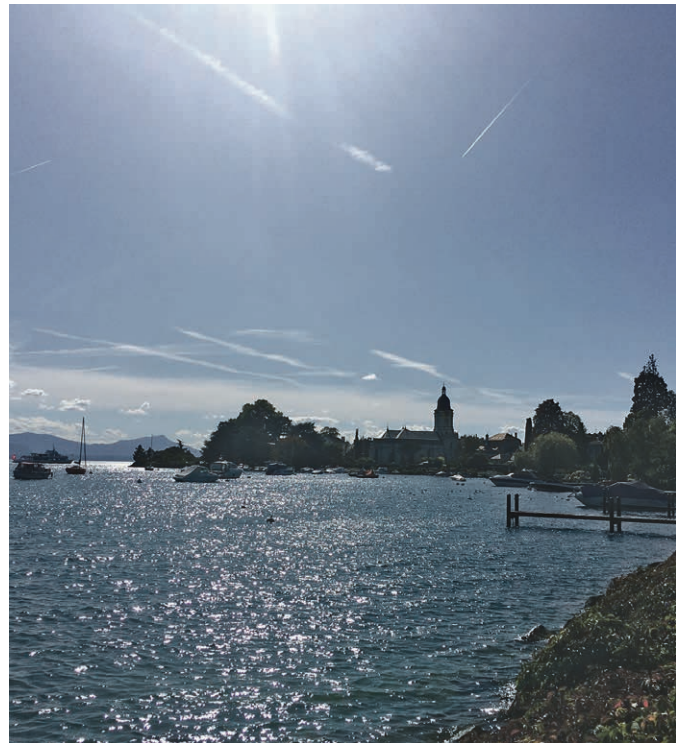
Temple de Morges et bord du lac.

Un culte public à 19h30 ouvrira la soirée et sera suivi des débats auxquels vous pouvez assister. Une bonne occasion de prendre la température de ce qui se vit dans notre Région.