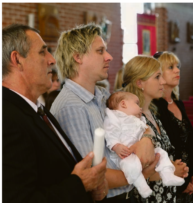
Retrouver la simplicité biblique du baptême.

Pour vivre l'importance du baptême, il devrait être ad-