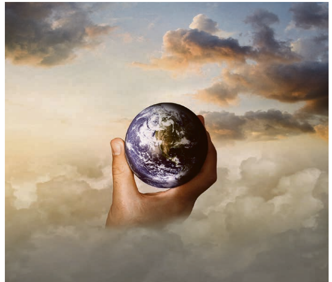
Salut écologie! Notre planète à sauver... pour qui? pour quoi?

Chaque mercredi, entre 13h et 14h15, Morges, cure du Bluard, place de l'Eglise 3. Accueil, entraide, écoute, of-