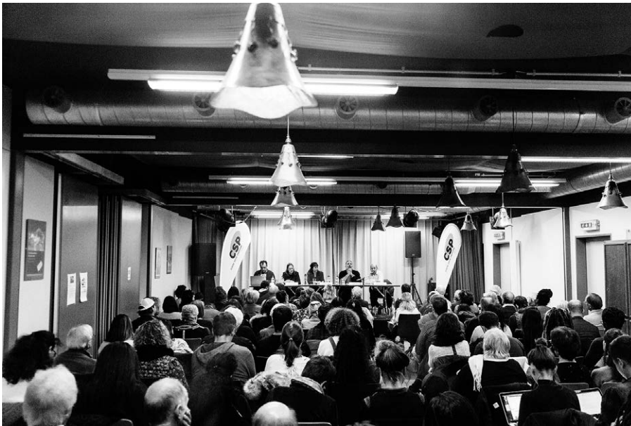
Réunion sur le sujet des sans-papiers en novembre 2018 à l'assemblée générale du CSP Vaud.

Le programme genevois qui a permis une régularisation inédite de personnes sans-papiers pourrait être repris dans d'autres cantons.