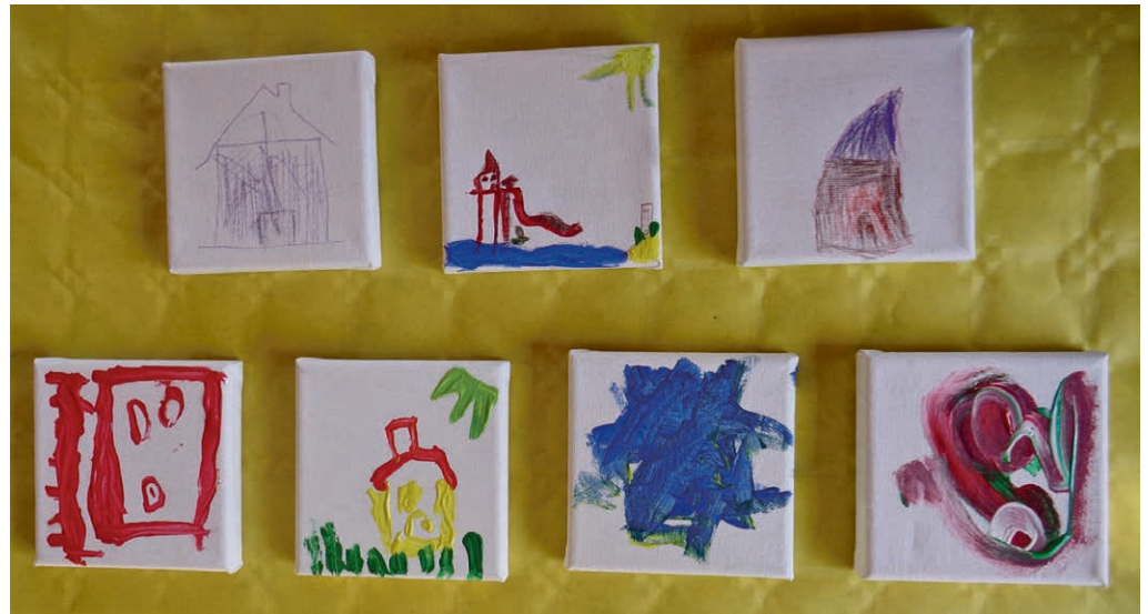
«Culte à 4 pattes»: dessinez-moi une maison! Juste avant d'entrer dans l'église, pour faire connaissance, pour s'approprier.

18h30 , église de Gimel. Une demi-heure de prière et de partage.