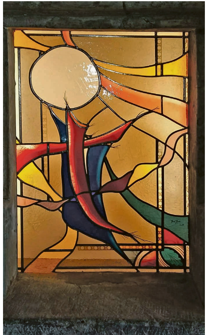
Vitrail à Denens.