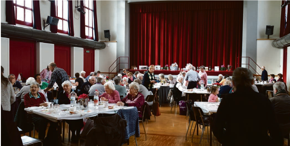
Bazar in Nyon, November 2018.