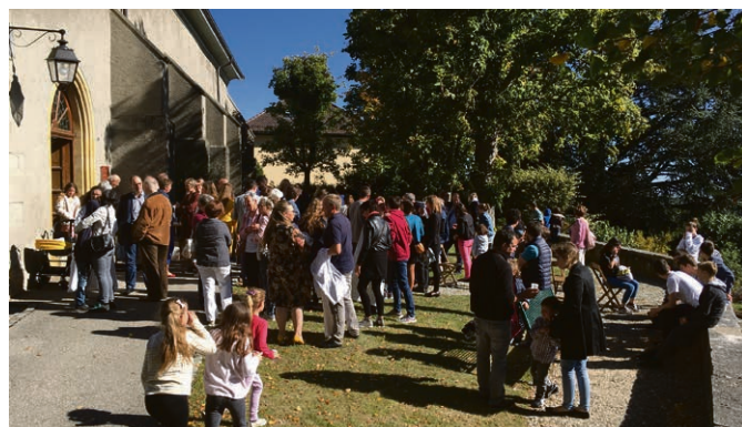
Culte Oasis festif à Pampigny le 29 septembre et ouverture des activités du Culte de l'enfance et du catéchisme.

Vendredi 6 décembre, 9h à 11h , école de Berolle, récolte de jouets en bon état (sauf peluches), qui seront distribués, pour la 3 e année consécutive, à deux associa-