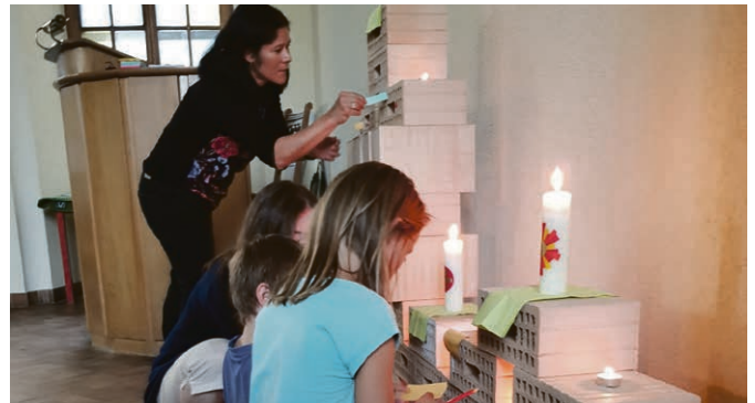
Les nouvelles célébrations vivantes et accueillantes attirent toutes les générations.

l'agape). L'assemblée constitue un moment important de notre vie paroissiale, claude.demissy@eerv.ch.