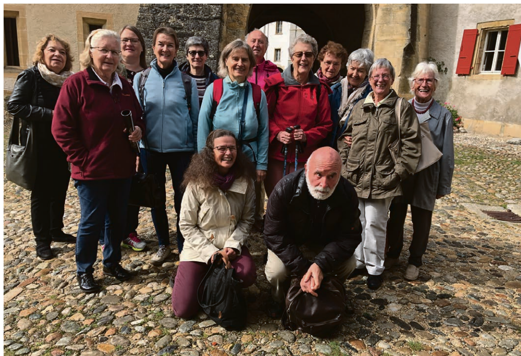
Temps de ressourcement à Romainmôtier pour les participants à l'office de Taizé: du soleil sur le chemin et dans les cœurs...

Dimanche 3 novembre, 10h15, temple de Morges, culte unique suivi d'un apéro. Thème: « la racine qui te porte ». Après une première édition l'an passé à Vullierens, la paroisse de Lonay-Préverenges-Vullierens et celle de Morges-Echichens célèbrent ensemble le culte. Dans l'Esprit de la Réforme, nous prions, chanterons et lirons la Parole, nous chercherons à renforcer les liens d'amitié entre les communautés de ces deux paroisses partenaires.