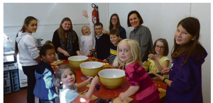
Les enfants préparent la salade, fruit de l'offrande lors de la journée au vert.

PULLY-PAUDEX Vous voulez rester informé de toutes les activités et nouvelles de la paroisse Pully-Paudex en plus du journal « Réformés »? C'est désormais possible grâce à notre nouvelle lettre d'information par e-mail! Pour vous inscrire, il suffit de le faire sur notre site internet ou sur: www.bit.ly/inscriptionnewsletterpully ou encore par e-mail à paroisse.pully@bluewin.ch . Profitez-en pour découvrir le site internet de la paroisse qui, pour le début de l'automne, a fait peau neuve! Vous pourrez aussi y retrouver toutes nos informations: www.pullypaudex.eerv.ch .