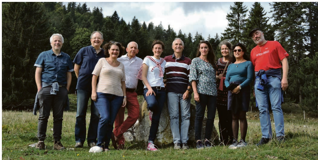
Le nouveau conseil de paroisse en train de s'organiser.

Dimanche 3 novembre , à la salle de l'Esplanade (rue du Bourg, sous le cinéma de Chexbres), l'Association du centre paroissial proposera son traditionnel repas de soutien. Raclette (au fromage de Bagnes) à gogo, desserts à choix, café, prix indicatif 30 fr. Inscription utile mais pas obligatoire au 079 668 32 20 (SMS