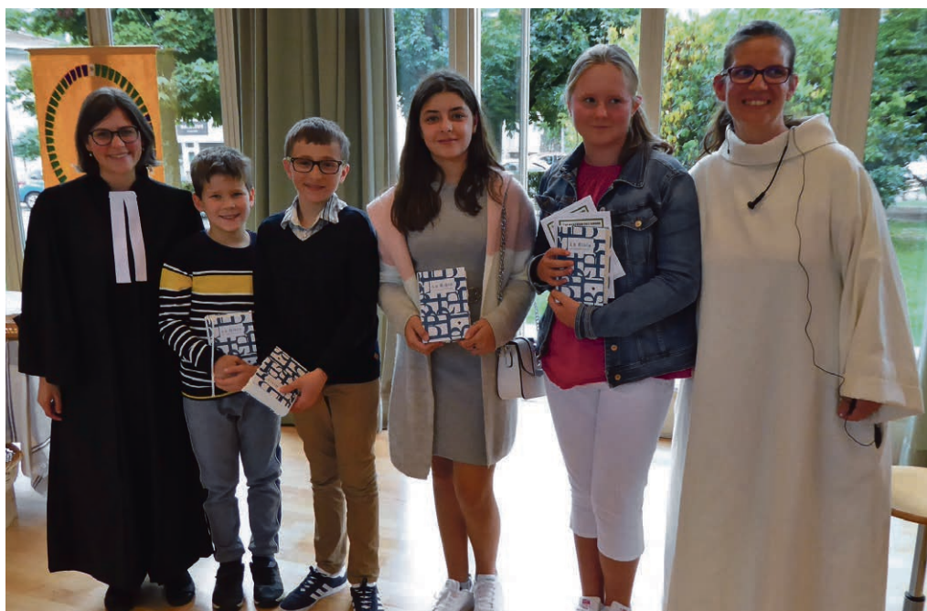
Les jeunes de Pully-Paudex et Belmont-Lutry ont reçu leur bible.

BELMONT-LUTRY Lors du culte du dernier dimanche de l'année ecclésiastique, la paroisse fait mémoire des événements qui ont jalonné la vie des familles de Belmont et Lutry. Ainsi, dimanche 24 novembre, à 10h , au temple de Lutry, vous pourrez entendre les noms des enfants baptisés, des jeunes baptisés ou confirmés aux Rameaux, des jeunes mariés de l'année et bien sûr de ceux qui nous ont quittés dans l'espérance de la résurrection. Ce culte sera suivi d'un apéritif qui conclura la célébration.