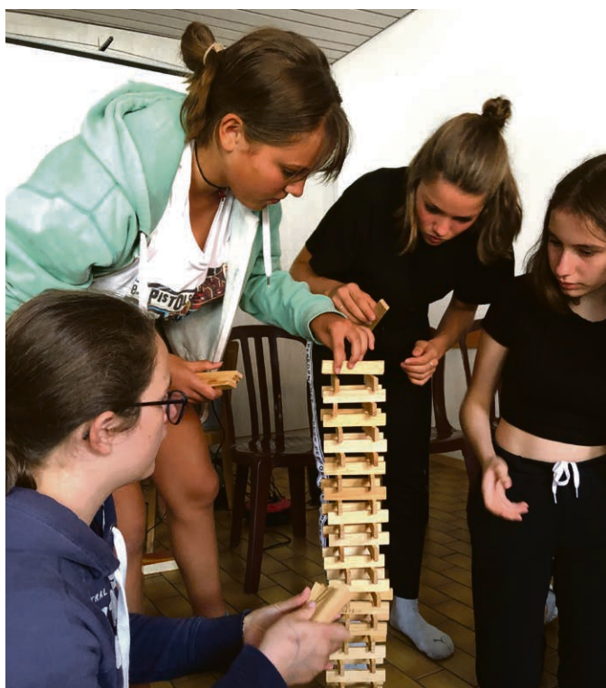
Les catéchumènes ont pu réfléchir tout en jouant.