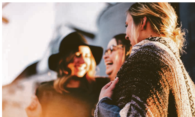
«Vous serez mes témoins.»