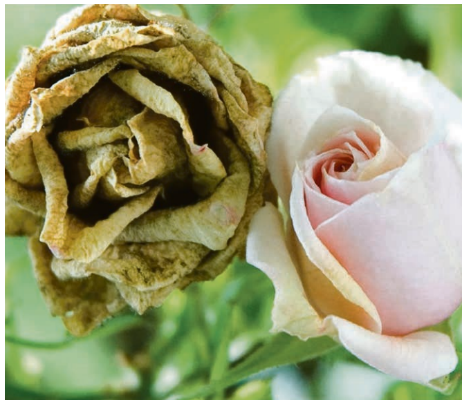
Cycle de conférences « La mort à vivre », lire ci-contre.

Le dimanche 17 novembre aura lieu l'Assemblée paroissiale d'automne à Forel, juste après le culte de 10h . Lors de cette assemblée, le budget sera voté ainsi qu'une élection complémentaire au conseil de paroisse. Merci pour votre présence pour ce moment important de la vie paroissiale.