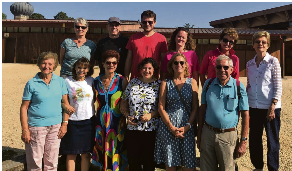
Week-end paroissial à Taizé.

Pour les 11 e : samedi 16 novembre , catéchisme régional. Culte en famille pour tous : dimanche 17 novembre, à 10h30 , au temple de Cully.