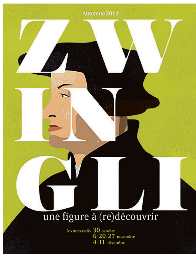
Une pensée libre à découvrir en cinq conférences et un film.