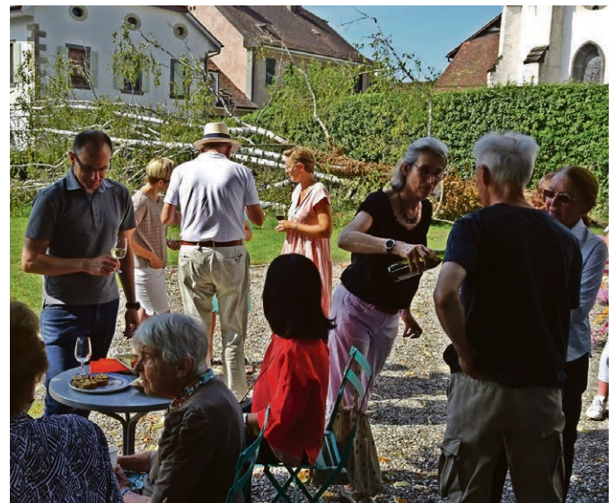
La tempête a passé, l'arbre s'est couché, et la vie continue.