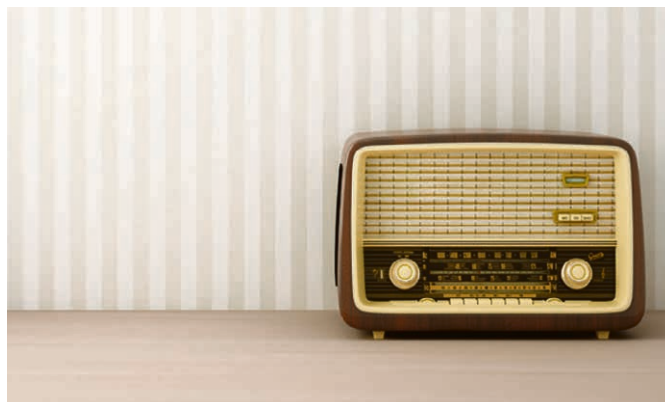
La tradition des cultes radio perdue. Rendez-vous à Crêt-Bérard.

La Petite Ecole de Témoignage a été reportée; les nouvelles dates vont du 18 janvier au 27 juin 2020 . Hâtez-vous de rejoindre le cursus pour revisiter votre foi, trouver des mots pour l'exprimer et vos façons de la partager. Inscrivez-vous dès maintenant, et avant le 20 décembre sur http://www.cret-berard.ch/activites/programme . ▴