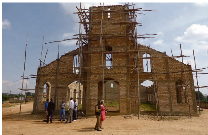
Des églises et des communautés en construction.

Un spectacle qui nous propose de devenir acteur et de concrètement faire quelque chose pour préserver la planète. Créé par le Laboratoire de transition intérieure qui fait partie de l'ONG Suisse Pain pour le prochain, ce spectacle est également porté par Action de carême. Animé par la conviction que l'on ne sortira pas des crises écologiques et socio-économiques sans un changement profond de notre système de valeurs et de nos modes de vie, ce laboratoire entend contribuer à la transition – personnelle et collective – vers un monde plus juste et respectueux de la nature, en synergie avec les alternatives qui émergent aux quatre coins du monde. Judi 28 novembre, de 20h à 21h30 , à la grande salle de Chardonne.