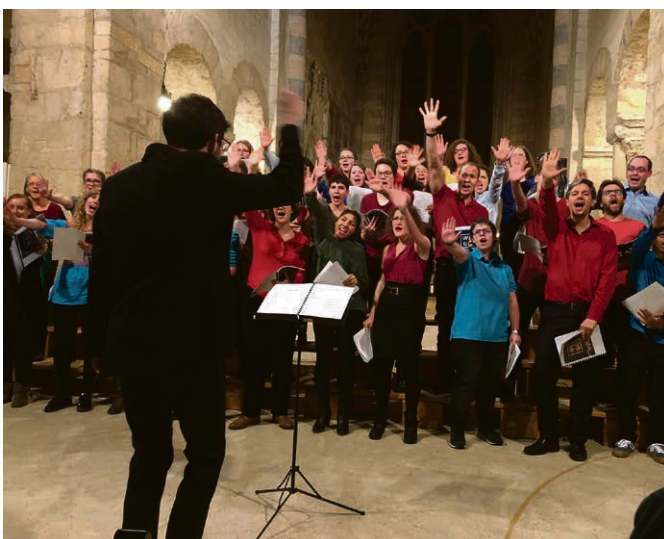
Les jeunes mettront tout leur cœur pour chanter cette année aussi comme en 2018.