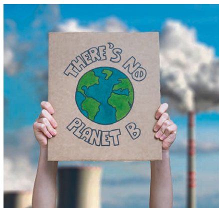
TABLE RONDE L'urgence climatique interpelle et divise. Comment agir ? Les institutions politiques sont-elles dépassées ? Que peut la désobéissance civile ? Quel est l'intérêt d'un travail spirituel et intérieur ? Le journal Réformés souhaite permettre au grand public de s'emparer de de ces questions, à quelques jours de l'ouverture de la COP25, à Santiago Du Chili.

En parallèle de son édition consacrée à l'urgence climatique, le mensuel Réformés organise son premier débat sur ce thème, le 21 novembre à Bienne.