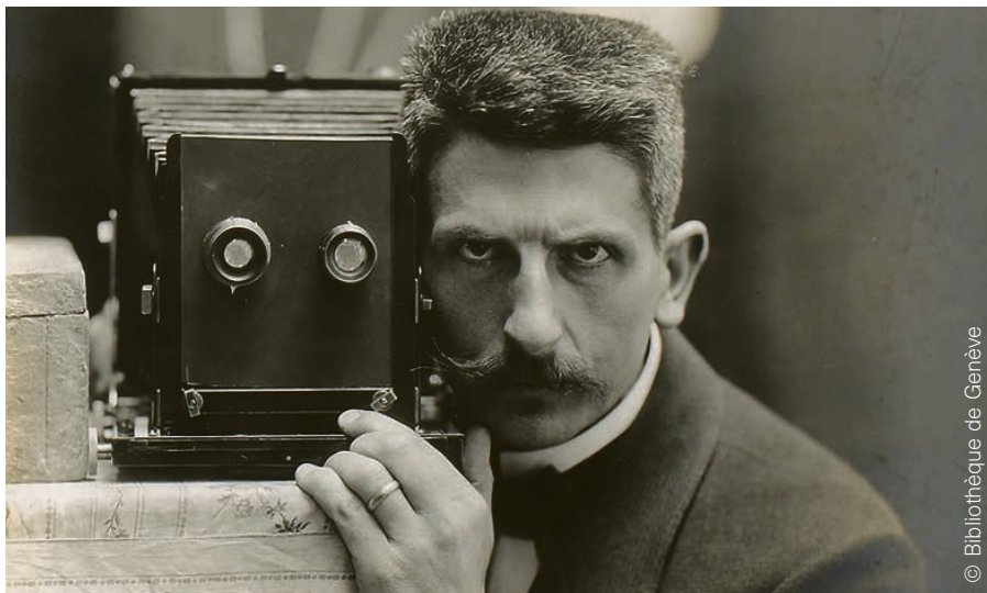
Autoportrait à l'appareil binoculaire, Fred Boissonnas, 1900.

« Après la Grèce, Fred Boissonnas cherchera d'autres voies pour repartir en Méditerranée, raconte l'historienne. Il était fasciné par des projets qui permettaient de restituer un paysage à une histoire. » Ainsi part-il sur les traces d'Homère. Il photographie les différents lieux qui auraient inspiré le récit des péripéties