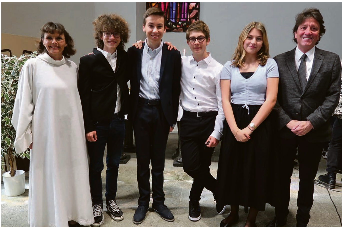
Culte des Rameaux le 28 mars.