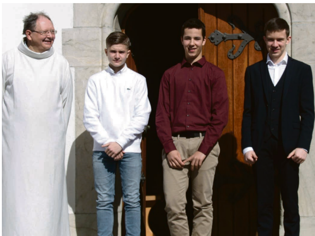
Trois jeunes qui se confient en Dieu : juste ce qu'il fallait pour remplir l'église de Chexbres le jour des Rameaux.