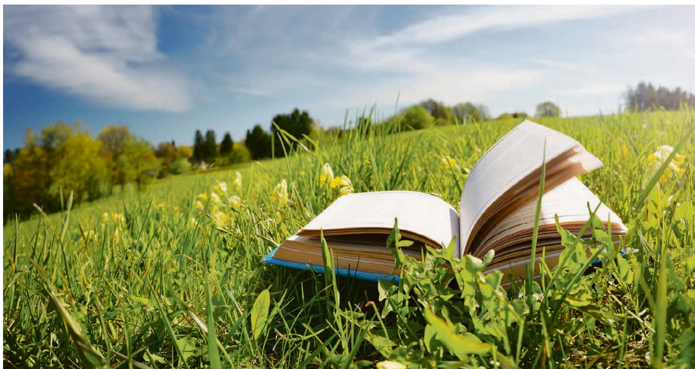
Le 8 mai, Zoom depuis Crêt-Bérard sur des livres à découvrir à travers huit auteurs.