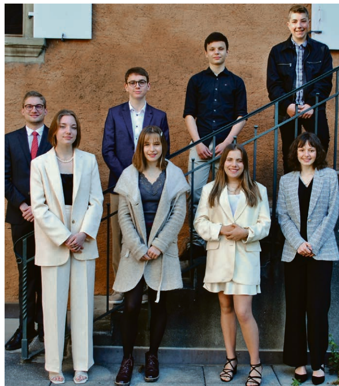
Les catéchumènes de la volée 2021 aux Rameaux.