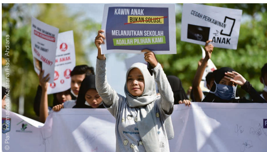
« Ne mariez pas un enfant. » Une campagne de PLAN international contre le mariage forcé en Indonésie (2020).

D'ici 2030, les organisations internationales anticipent 13 millions de mariages d'enfants supplémentaires à la suite de fermetures d'écoles et d'une pauvreté accrue. La Suisse est aussi concernée : le Service contre les mariages forcés a accompagné 361 situations en 2020, soit 14 de plus qu'en 2019. Sur ces 361 cas, 133 concernaient des mineur·e·s. « L'école à distance a exacerbé le contrôle intra-familial, et aussi les tensions autour de ces situations », constate Anu Sivaganesan, présidente de ce service. L'impossibilité des voyages à l'étranger aurait pu freiner ces situations. « Mais des unions ont tout de même été réalisées à distance, par Skype. » Si, juridiquement, un tel mariage n'a aucune valeur, « pour les personnes concernées et leur communauté, l'acte est valable, et sa signification est puissante et lie les gens », décrypte la juriste.