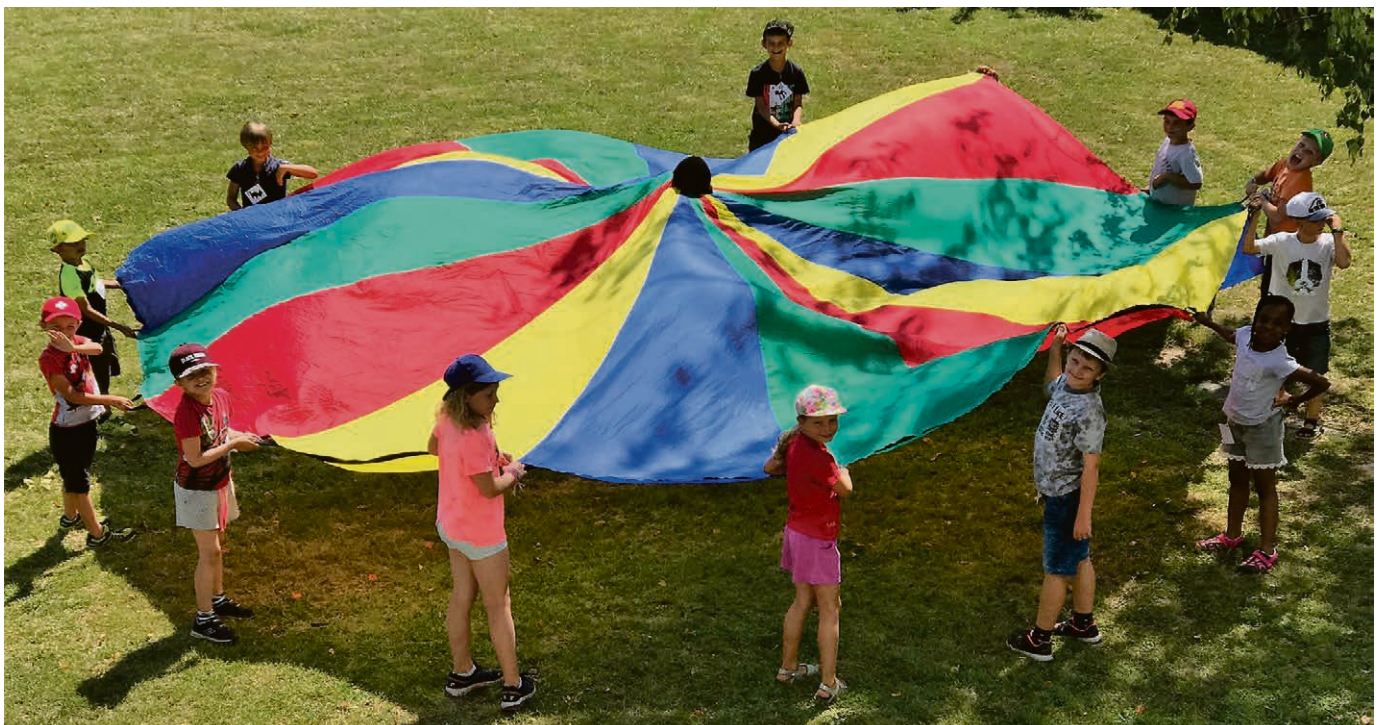
Des camps pour se faire des amis.