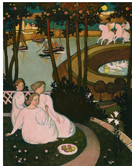
Maurice Denis, Légende de chevalerie (Trois jeunes princesses) , 1893 MCBA.

Cette recherche d'élévation, cet amour de la nature, de la femme et de l'art qui s'expriment dans les œuvres du peintre, placent le spectateur au-delà de l'agitation de la vie moderne, le laissant entre ciel et terre. ■ Elise Perrier