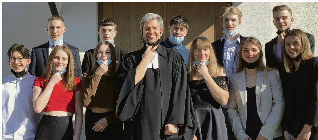
Les volées 2020 et 2021 ont pu vivre leur culte de confirmation le 28 mars en deux cultes.

Dans le but d'offrir du temps pour soi, la paroisse invite les parents à un espace de ressourcement pour essayer de reprendre du souffle. Ainsi, le lundi 3 mai, de 9h à 11h , un espace garderie est proposé à la salle de la cure pour les enfants qui ne sont pas à l'école, pendant que les parents peuvent vivre un temps de méditation et de