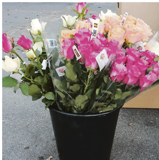
Roses vendues pour le droit à l'alimentation en faveur de Pain pour le prochain par les catéchumènes de 9e.

A été baptisé le 7 mars 2021, Julius Evans-Onstad.