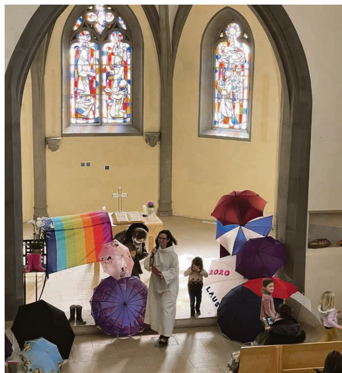
Reflets du culte familles du 21 mars, pour la justice climatique.