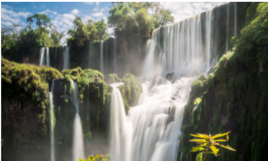
Les chutes d'Iguazú à la frontière entre Argentine et Brésil.

Du 1 er septembre au 4 octobre, les Eglises chrétiennes célèbrent la Création selon la devise « des fleuves d'eau vive ».