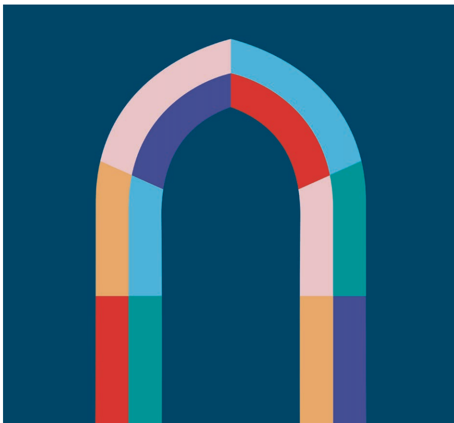
Le visuel des célébrations du 750 e anniversaire de l'église Saint-François.

Durant toute l'année 2022, ce sont donc plus de soixante événements qui vont célébrer ces 750 ans d'histoire. Notamment, du 2 mars au 16 avril, le projet