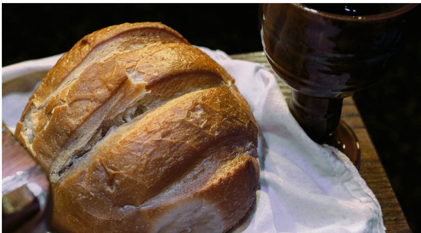
Pouvoir communier à domicile.

menacent les moyens de subsistance d'un nombre croissant de personnes dans les pays du Sud. C'est pourquoi les organisations EPER et Action de carême nous invitent à prendre nos responsabilités et réitèrent la devise « Justice climatique, maintenant ! » lors de la campagne œcuménique 2022. Et si... Et si dans ce temps de carême chacune et chacun d'entre nous faisait un petit geste pour contribuer à lutter concrètement pour la justice climatique ? Les exemples sont nombreux : renoncer à un trajet en voiture, remplacer une ancienne ampoule par une ampoule LED, renoncer à un achat, etc. Vous trouvez d'autres pistes ici : https://voir-et-agir.ch (puis cliquez sur « campagnes » et « agir »). Chaque geste compte ! Ecoutez une légende amérindienne, racontée par Pierre Rabhi : un jour, dit la légende, il y eut un immense incendie de forêt. Tous les animaux terrifiés, atterrés, observaient impuissants le désastre. Seul le petit colibri s'activait, allant chercher quelques gouttes avec son bec pour les jeter sur le feu. Après un moment, le tatou, agacé par cette agitation dérisoire, lui dit : « Colibri ! Tu n'es pas fou ? Ce n'est pas avec ces gouttes d'eau que tu vas éteindre le feu ! » Et le colibri lui répondit : « Je le sais, mais je fais ma part. »