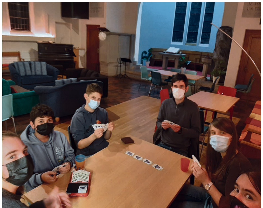
Soirée jeux pour tous les âges !

Vendredi 18 mars, de 20h à 23h , église de La Sallaz – E4C. S'offrir un temps de jeux avec d'autres ! Prochaine date : 15 avril.