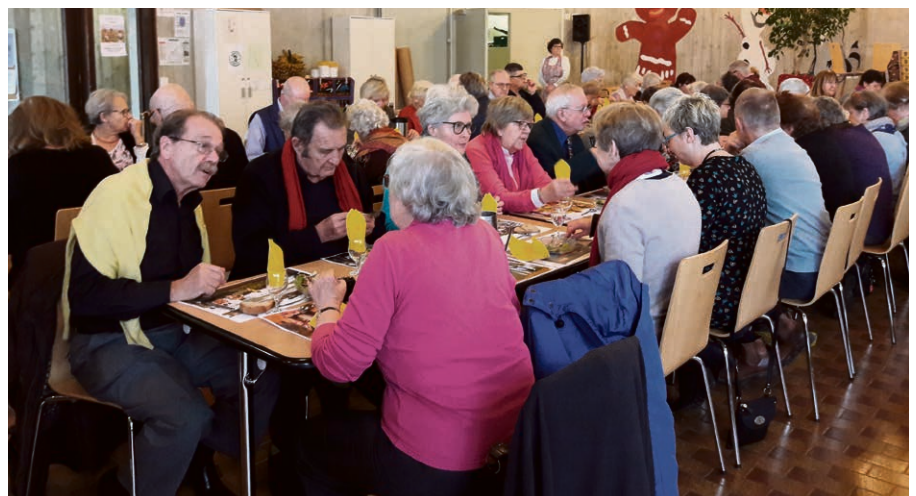
Un moment convivial à Saint-Matthieu en 2018.