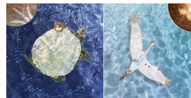
Along the River of Spacetime (Le Long de la rivière de l'espace-temps) par Elizabeth LaPensée, 2019.