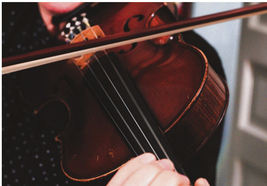
Un culte de l'offrande accompagné de belle musique.