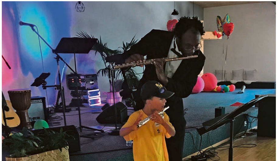
Des fruits pour petits et grands... © Pierrette Fardel

Nos vies ont besoin d'être accordées, réaccordées pour porter de beaux fruits pour les autres! Et c'est l'une des spécialités de Dieu, l'un de ses grands bonheurs! ▲ Pierrette Fardel