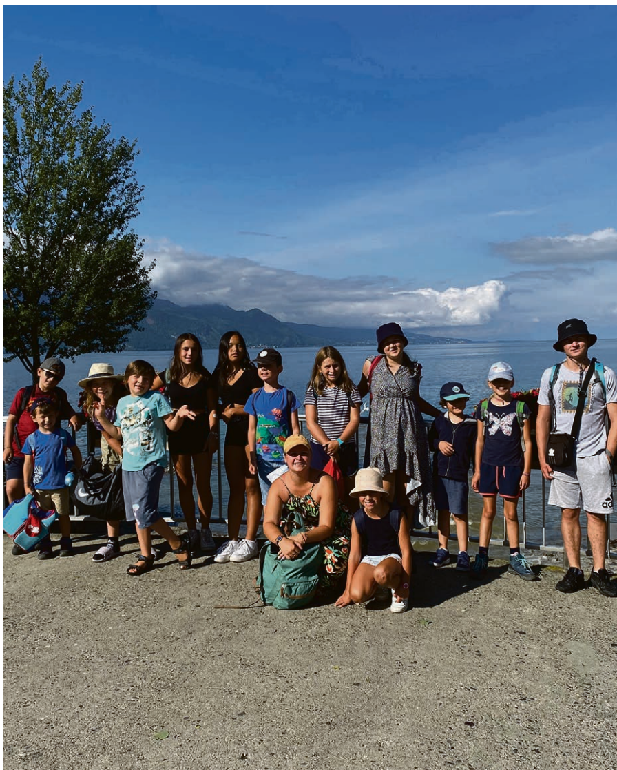
Jour des poissons.