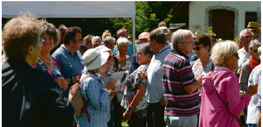
L'heure de l'apéritif, l'heure est aux retrouvailles.