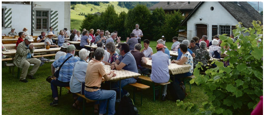
Les convives ont pu savourer des produits locaux dans les jardins de la maison de paroisse.

animatrice de camps (Jack) et ne semble pas regretter son déplacement.