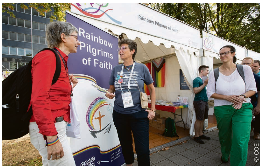
Le stand du pèlerinage arc-en-ciel a accueilli de nombreuses conversations sur l'inclusivité des Eglises.

S'il y a bien un point sur lequel la discussion œcuménique bute, ce sont les diverses sexualités humaines. Conscient de l'écart entre ses membres, le COE a élaboré un outil pour traiter ces questions.