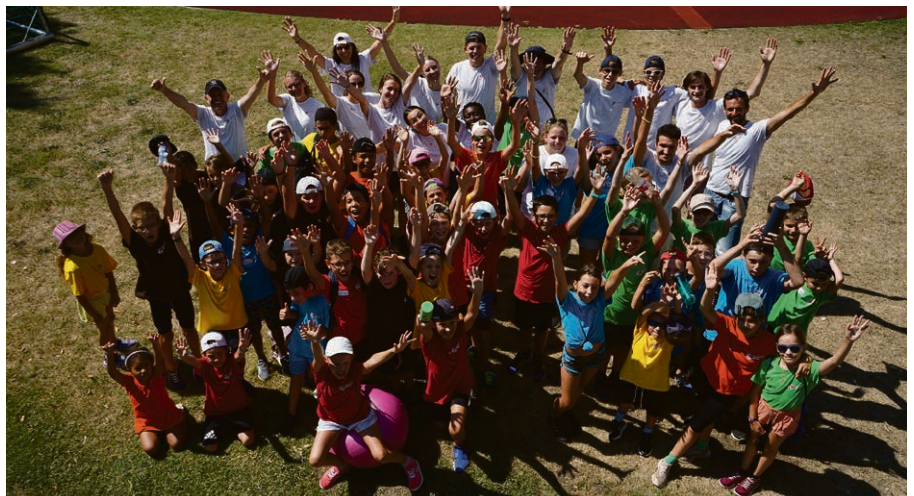
Des graines de bonheur...