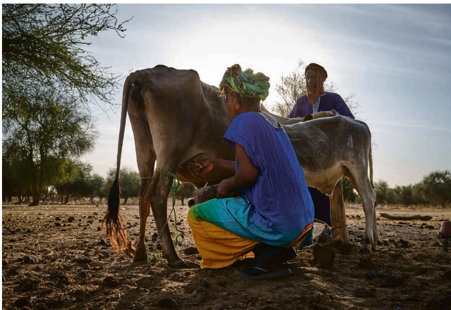
Une femme qui vend régulièrement du lait à l'unité de transformation gagne en moyenne 124 000 francs CFA par an (182 francs suisses). Un revenu complété par d'autres activités, mais bien inférieur au revenu sénégalais moyen (4000 francs environ).

Devant cet avenir incertain, le Cerfla, soutenu par l'EPER, encourage également les femmes à développer des activités complémentaires : vente de fruits et légumes, fabrication de savons ou de gâteaux de jujube. ▲ Camille Andres