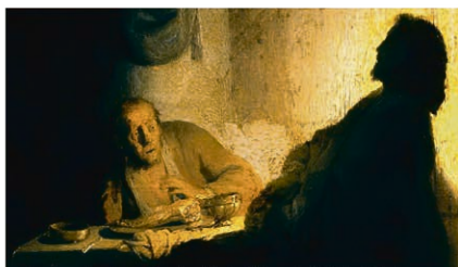
Rembrandt: la surprise du pèlerin d'Emmaüs (1648)