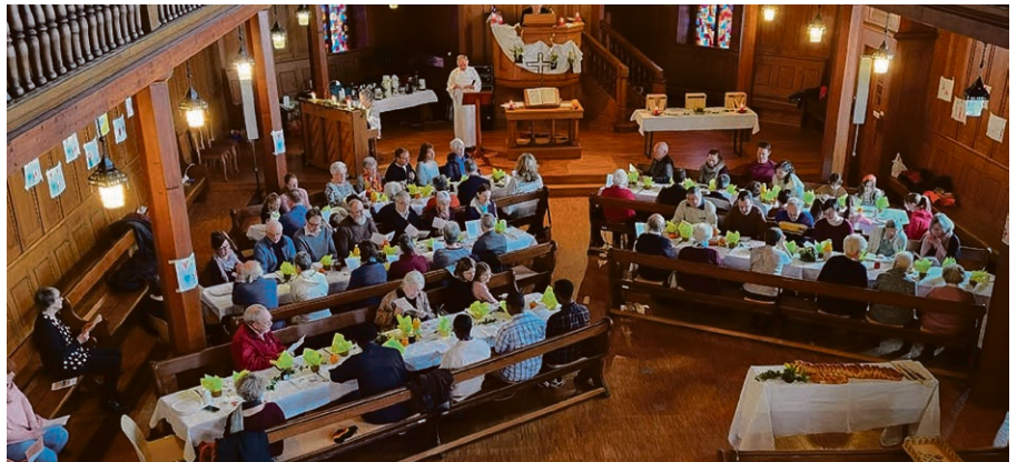
Un beau moment de partage et de fête.

Oui, c'est un privilège d'avoir une ribambelle de jeunes qui viennent tous les jeudis midi en période scolaire pour vivre les activités de « Bravo la Vie!». Mais ce ne