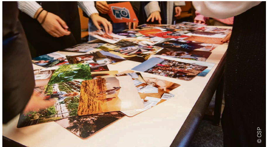
Au cours d'un atelier de prévention du surendettement auprès des jeunes, en novembre 2023. Les jeunes choisissent une image du photolangage pour parler librement de ce que cela évoque pour elles et eux, en lien avec l'argent.

La pauvreté des jeunes n'est pas due à une question de responsabilité personnelle, même si la « culture de la consommation, les paiements réalisés de plus en plus facilement et de manière