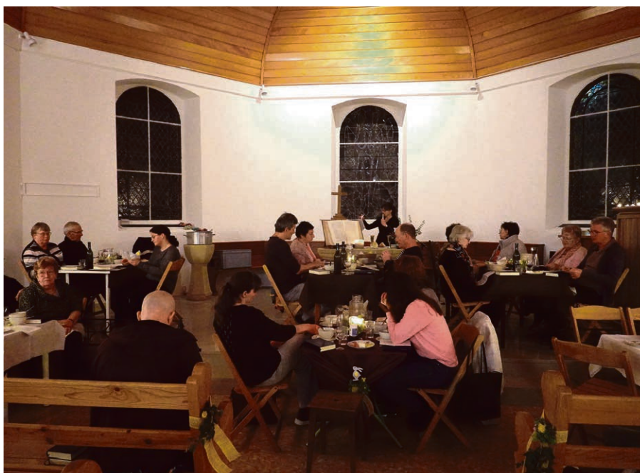
Jeudi saint à Fiez.