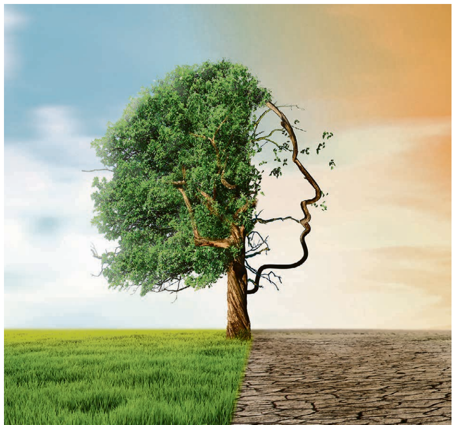
Printemps, renouveau... Quand l'esprit rejoint la nature.

Quatre rencontres, les 28 et 30 mai, 11 et 13 juin, de 20h à 22h , à Yverdon ; ou à Sainte-Croix les 14 et 16 mai, 4 et 6 juin , même horaire. ▲