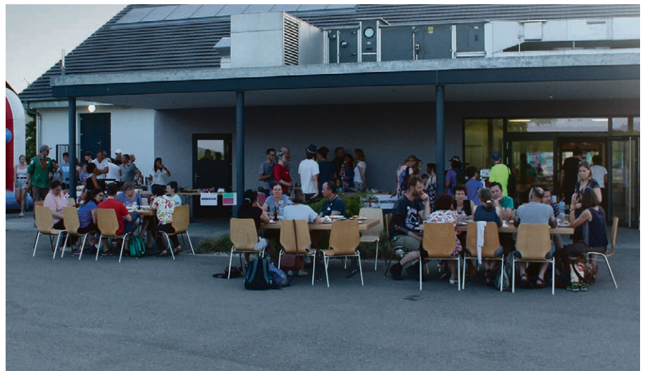
Souvenir des WSG en 2022, moment convivial sur la terrasse de la grande salle.

Réservez d'ores et déjà la journée du 13 juin pour notre traditionnelle sortie récréative.