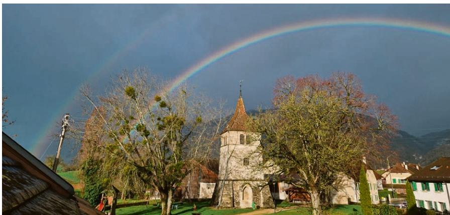
Le clocher de l'ancienne église de Peney.

manche 2 juin , tous: enfants, jeunes et moins jeunes, venez vivre une journée conviviale au refuge de Valeyres-sous-Montagny. Culte tous âges, animé musicalement par Cédric Pillard à l'accordéon, puis apéritif. Dès 12h , possibilité de faire des grillades (chacun amène sa viande). Apportez également une salade et un dessert à partager sous forme de buffet. N'oubliez pas de prendre votre assiette et vos services, ainsi que des jeux de circonstance (extérieurs et/ou intérieurs) à partager l'après-midi avec celles et ceux qui seront là!