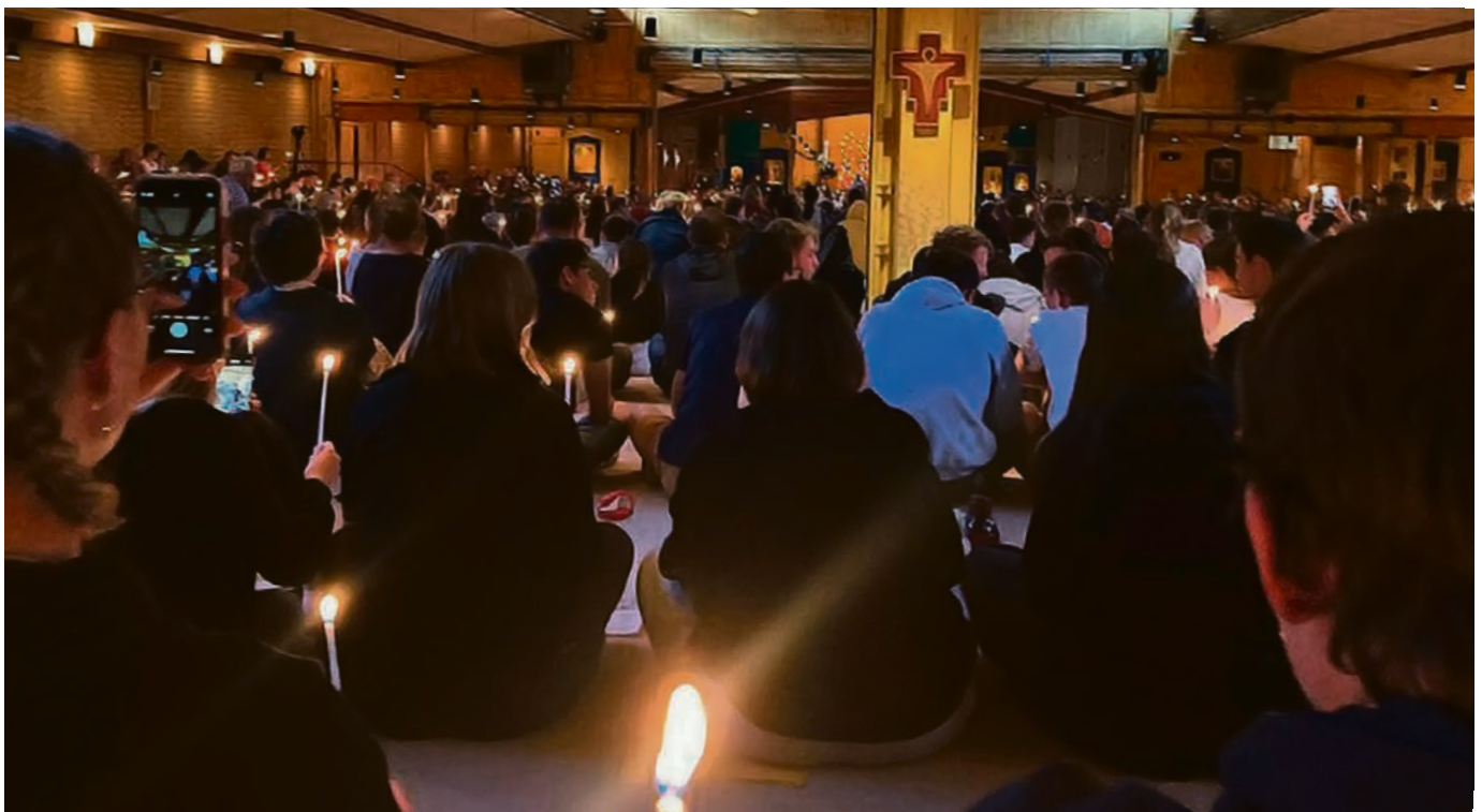
Prière dans la chapelle, à Taizé.

A l'issue du culte, un temps de convivialité (chacun est cordialement invité) et de reconnaissance envers tous les bénévoles des différents conseils est organisé à la maison de paroisse (à mi-chemin du parking ou de la gare !). Un brunch « digne du Balcon » vous attendra !